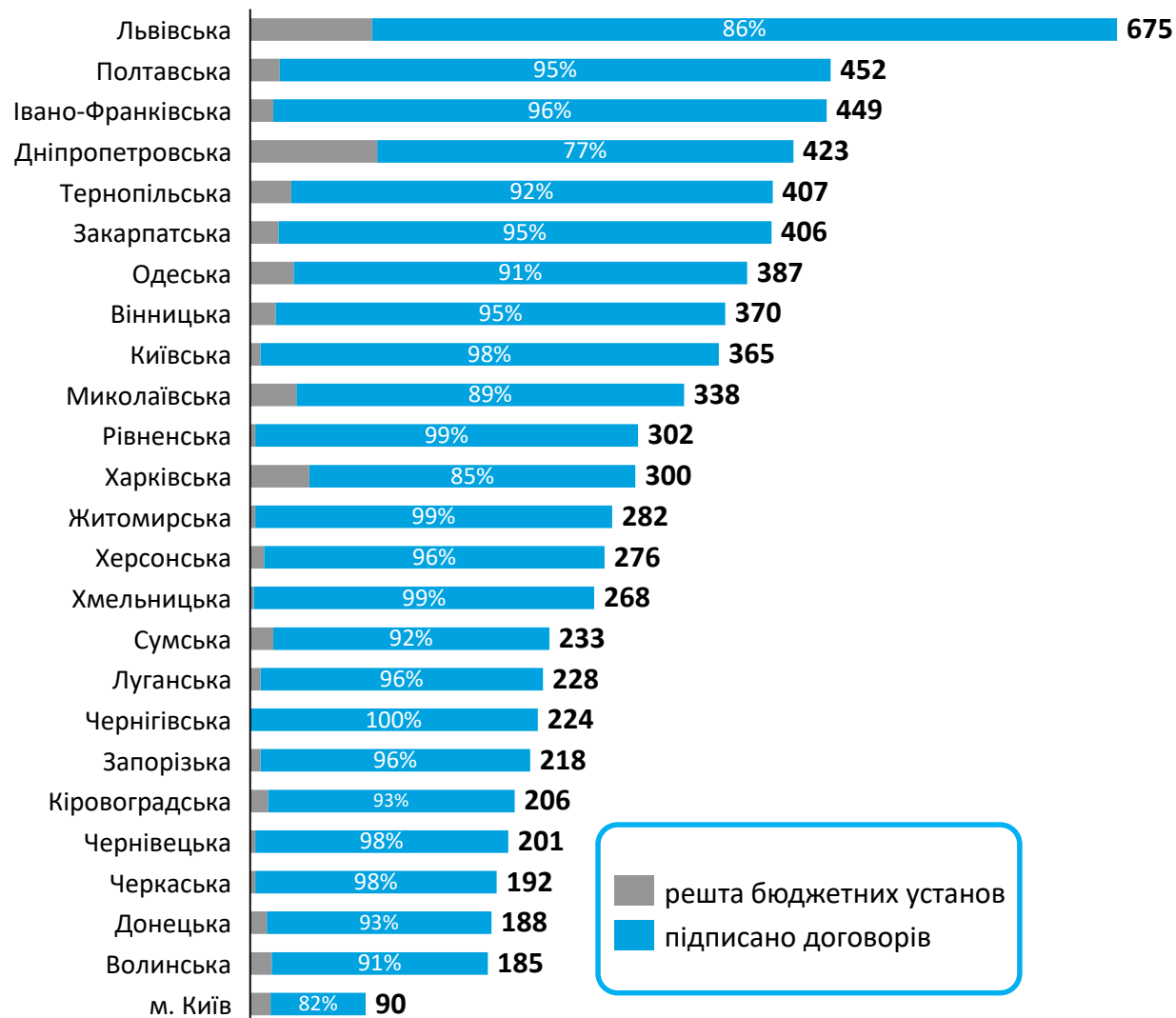
Підписано договорів в розрізі областей