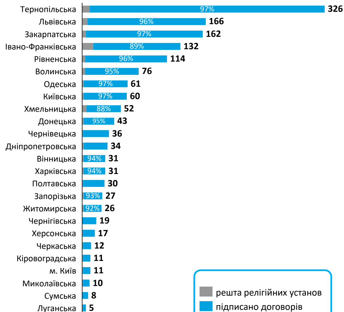
Підписано договорів в розрізі областей