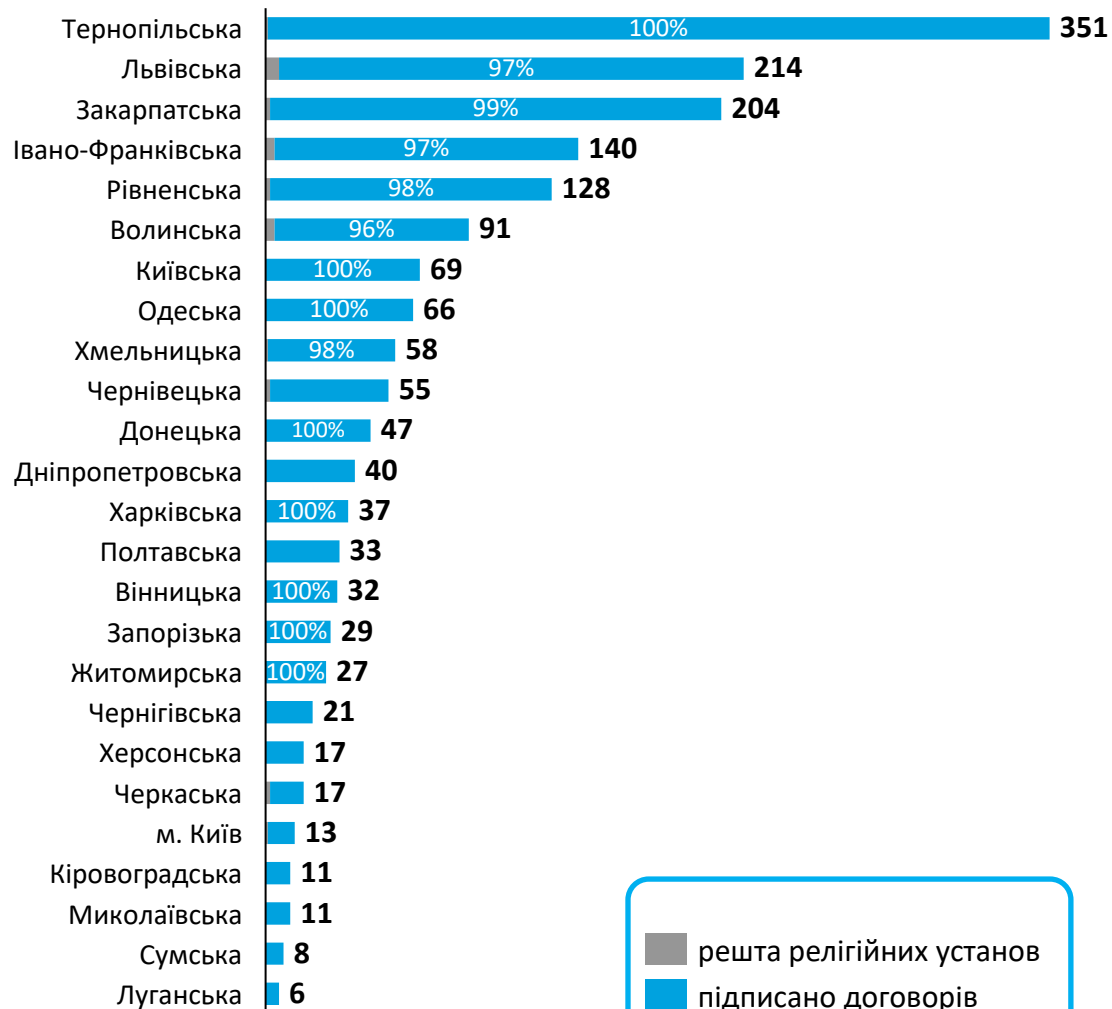
Підписано договорів в розрізі областей