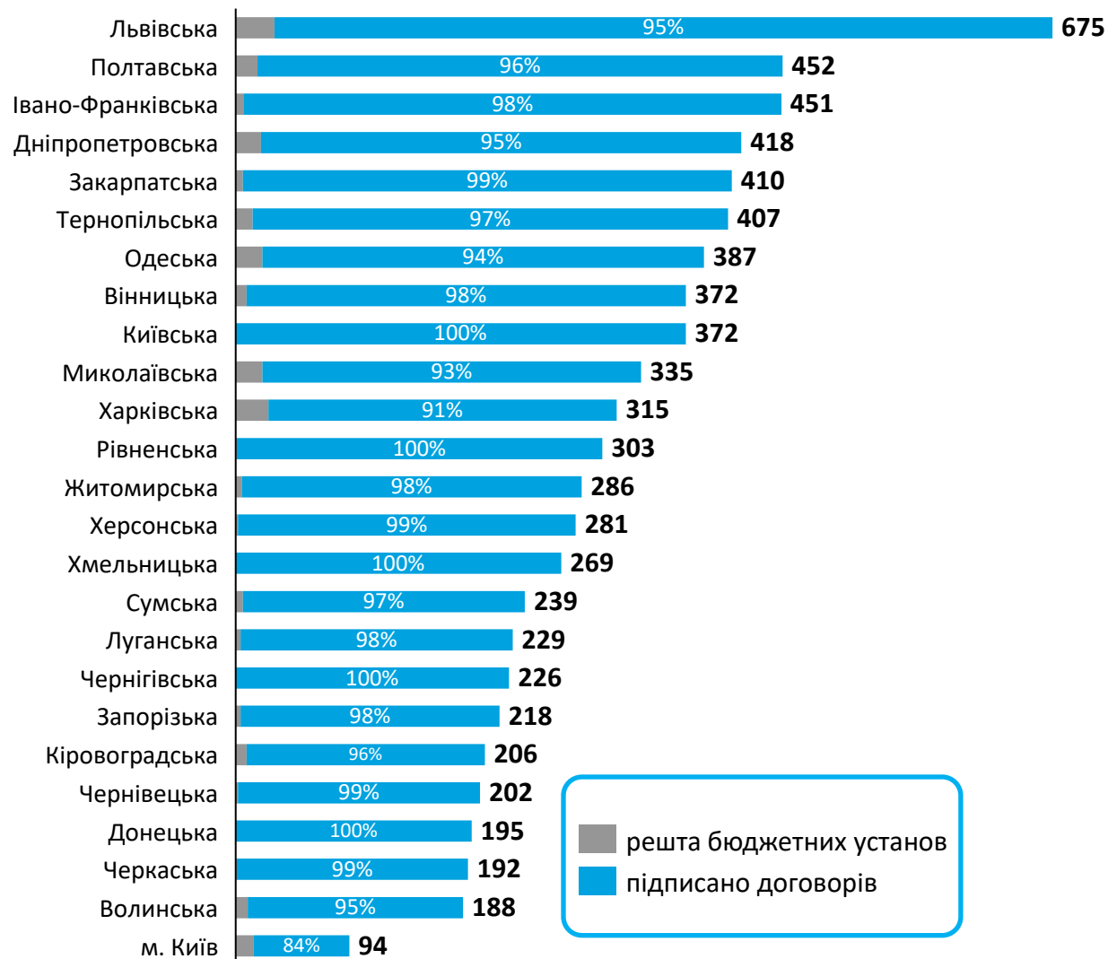
Підписано договорів в розрізі областей