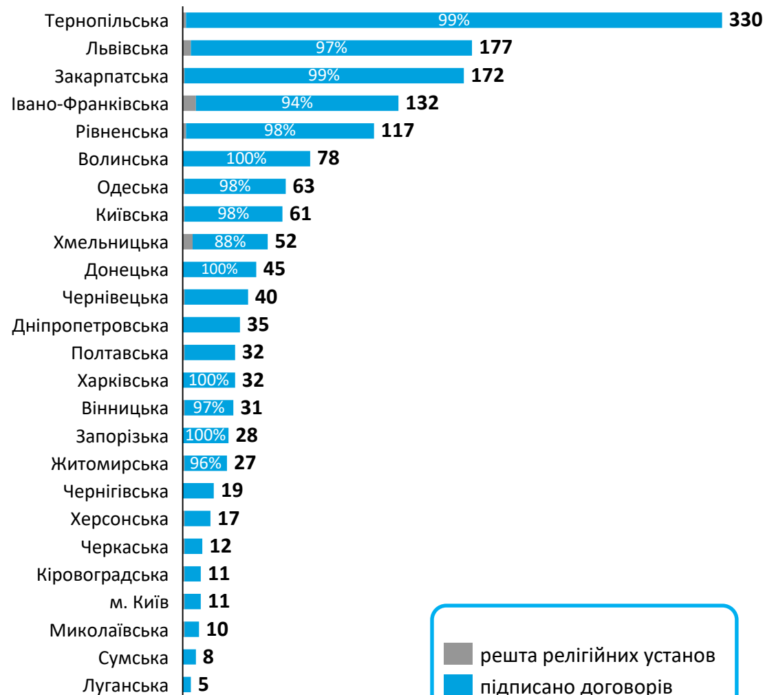
Підписано договорів в розрізі областей